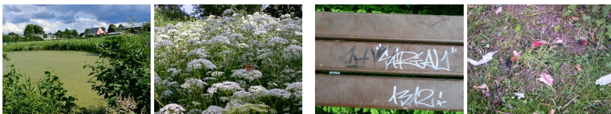
Beispiele für „Schätze“

Beim Rundgang wurden einige schöne „Schätze“, aber auch weniger schöne „Probleme“ entdeckt und fotografiert: